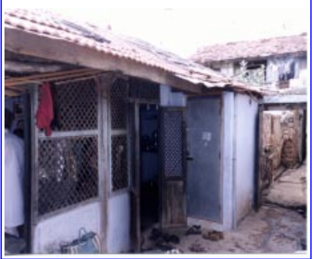
જન્મધામ - સુરેન્દ્રનગર (મોસાળ)