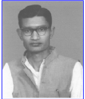
નિજ સ્વરૂપના વિયોગવશ ઉદાસીનતા

બાજુના ગામડામાંથી અડધી રાત્રે રવાના થઈ એક ખેડુત ગાડુ લઈને ઉકરડો