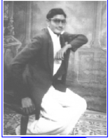
ઉમર વર્ષ - ૧૯

એક વખત મુંબઈમાં પેઢી ઉપર બેઠા છે, તેવામાં સાથે કામ કરવાવાળા એક સદ્ગૃહસ્થ આવી, હાથ જોડીને ક્ષમા માગે છે. ત્યારે આશ્ચર્ય સાથે ક્ષમા માંગવાનું કારણ પુછે છે અને ત્યારે જાણવા મળે છે કે જૈન ધર્મમાં આ પ્રકારે આખા વર્ષ દરમ્યાન જો કોઈપણ પ્રકારે એક-બીજા પ્રત્યે દોષ થયો હોય તો તેની ક્ષમા માંગવામાં આવે છે. આનંદાશ્ચર્ય સાથે જૈનદર્શન પ્રત્યે અહોભાવ જાગે છે અને આકર્ષણ થાય છે અને રાણપુરના બાળપણનો દિવસ યાદ આવે છે; ત્યાં